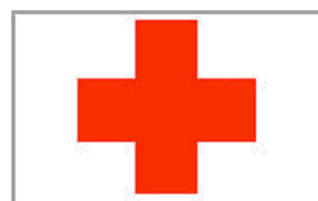
Deutsches Rotes Kreuz